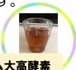
プレミアム大高酵素

大体1食が150mlから200ml相当になります。一食置き替えのプチ断食でも良いのです。ちょくちょくしてあげると悲鳴をあげて、疲れていた体も休めることができ、内臓さんはほっとして、また元気に働いてくれます。なので、1食置き換え、2食置き換え、3食置き換えなどご自分のできる範囲でやってもらうと良いです。