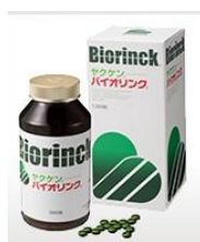
5,184 円 ビタミン、植物たんぱく質、 ミネラル補給 (おかず)